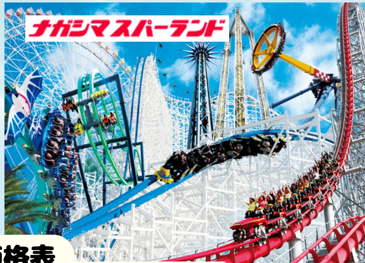
ナガシマスパークランド