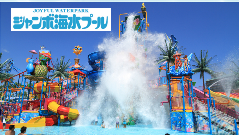
JOYFUL WATERPARK ジャンボ海水プール