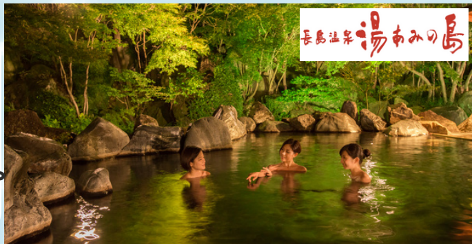
長島温泉 湯あみの島

また、令和6年3月1日より、紙チケットは完全に廃止となり、電子チケットに変更となります。補助券の購入の仕方や施設入場の方法については裏面をご覧ください!